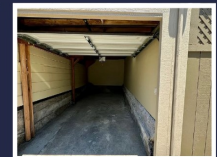
SPACIOUS ONE CAR GARAGE